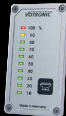
Fäkal- tankanzeige S