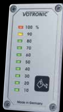
Abwasser- tankanzeige S

Im Dauerbetrieb vermittelt die stetig steigende oder fallende Anzeige das direkte Abbild des Tankinhaltes. So kann z. B. der Frischwassertank dosiert gefüllt werden.